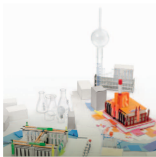
Artwork: A. Lieschke

Verantwortung: »Mittendrin. Eine Universität macht Geschichte« 16. April - 15. August 2010 Jacob-und-Wilhelm-Grimm-Zentrum Geschwister-Scholl-Str. 1, 10117 Berlin Geschichte wird lebendig: Diese Ausstellung nimmt Sie mit auf eine Reise durch die bewegte Hochschulgeschichte. Erfahren Sie, wie alles begann und was daraus geworden ist. Sehen Sie Orte der Wissenschaft und zahlreiche Objekte von Rektoren, Studierenden und Lehrenden.